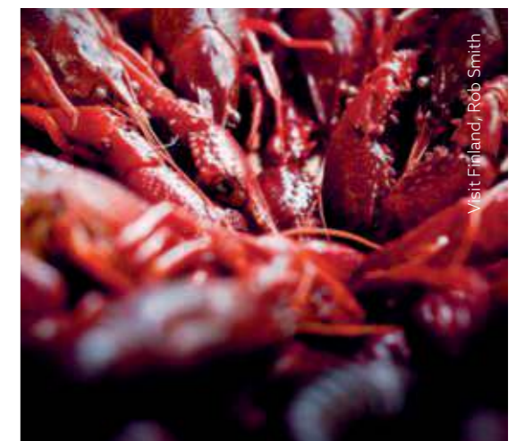
Visit Finland, Rob Smith