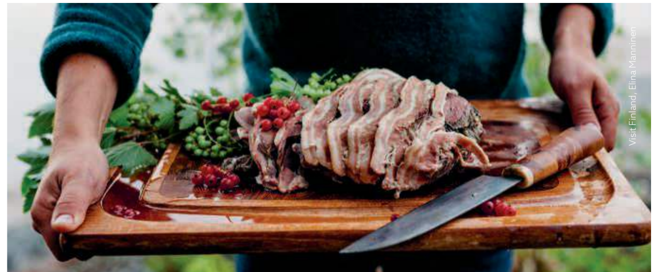
Visit Finland, Elina Manninen