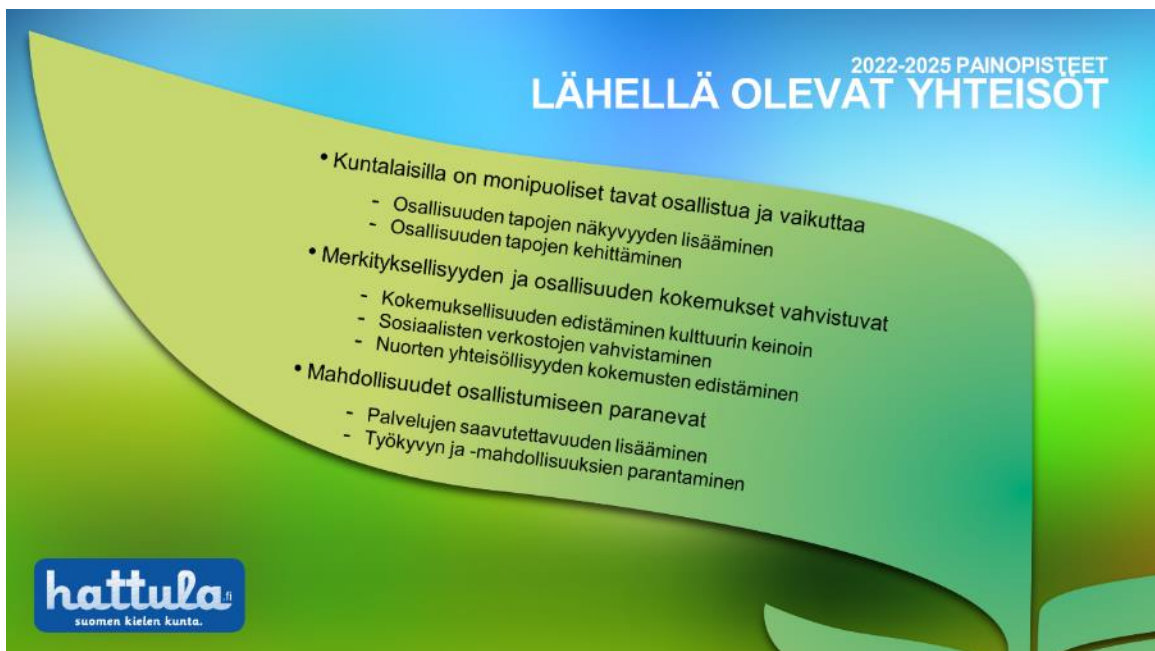
Kuva 4 Tavoitteet ja osa-alueet