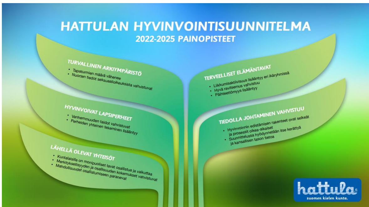
Kuva 1 Hattulan hyvinvointisuunnitelman 2022-2025 painopistealueet

Hyvinvointikertomukseen ja hyvinvointisuunnitelmaan voi tutustua tarkemmin kunnan verkkosivuilla .