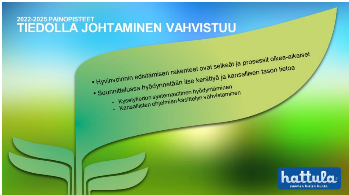
Kuva 6 Tavoitteet ja osa-alueet