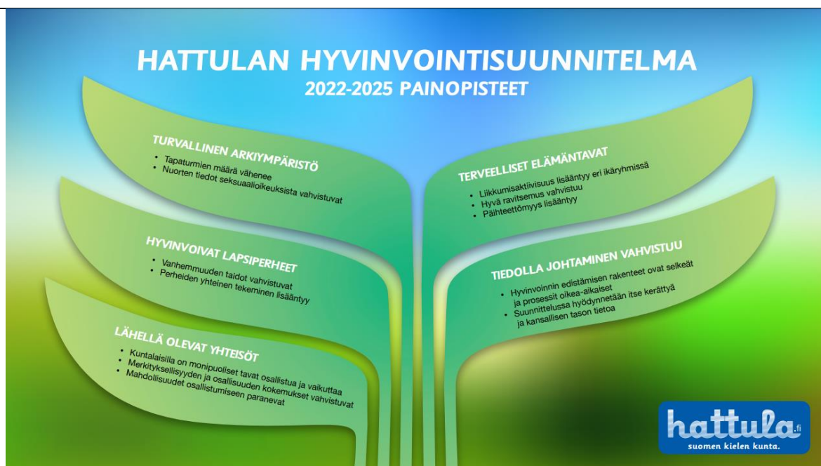
Kuva 1 Hattulan hyvinvointisuunnitelman 2022–2025 painopistealueet