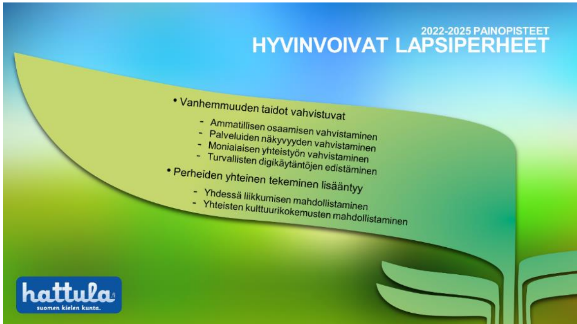
Kuva 3 Tavoitteet ja osa-alueet