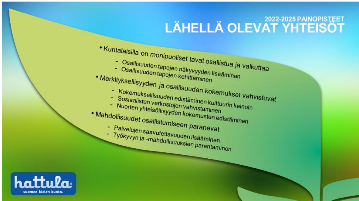
Kuva 4 Tavoitteet ja osa-alueet