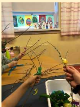
kuva: Virpomisoksien valmistelua.

Nuorten pelimaailmaa, tuhti pläjäys hevosia, tarinoita, vinkkejä, kiperiä pulmia ja uutisia tottakai! Never ending stories ja horoskoopit... 😊 Kaikkea tätä Lepaalta 😊