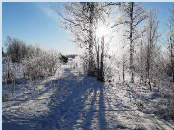
kuva: Talvinen pakkasaamu Lepaalla: Ismo Tiihonen