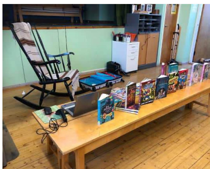
Kuva: Pilvin vierailu 3-4-luokassa kirjavinkkauksella.