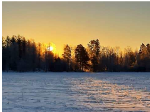
kuva: Kevätaurinko: Ismo Tiihonen.