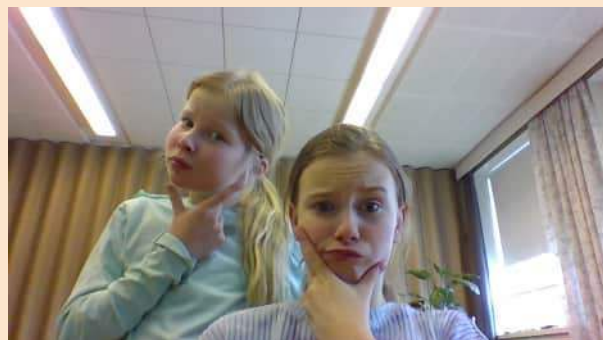
kuva: Vastaavat toimittajat: Miia & Iina