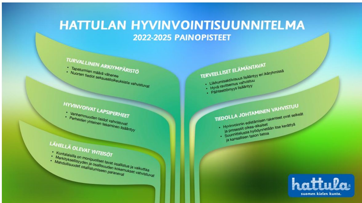
Kuva 1 Hattulan hyvinvointisuunnitelman 2022-2025 painopistealueet

Hyvinvointikertomukseen ja hyvinvointisuunnitelmaan voi tutustua tarkemmin kunnan verkkosivuilla .