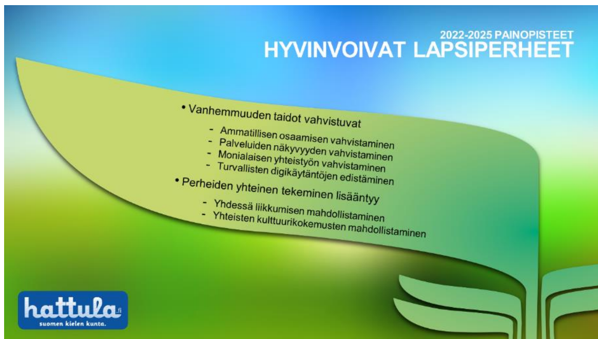
Kuva 3 Tavoitteet ja osa-alueet