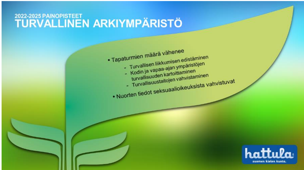
Kuva 2 Tavoitteet ja osa-alueet