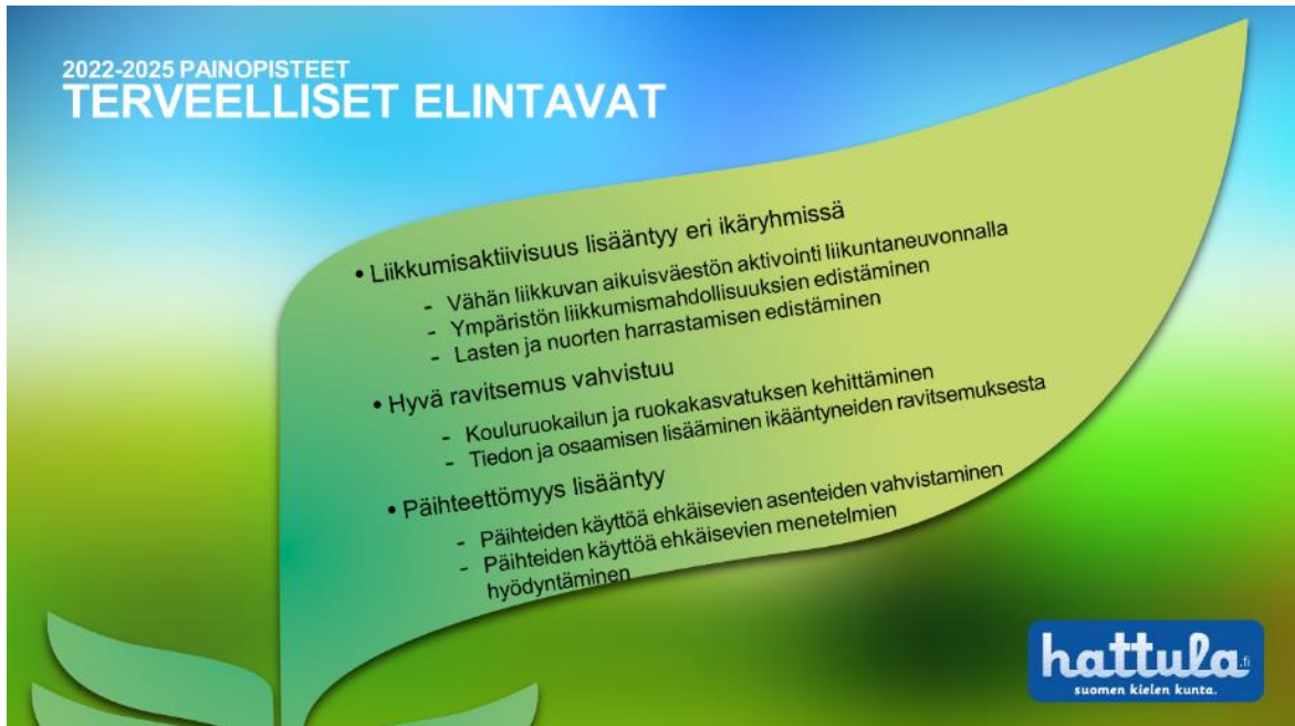
Kuva 5 Tavoitteet ja osa-alueet