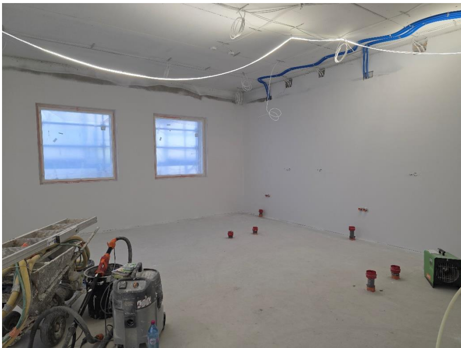
1. krs luokkahuoneiden tasoitetyöt käynnissä