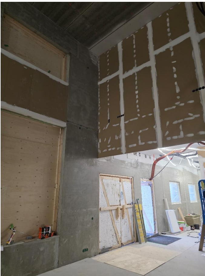
1. krs Aula