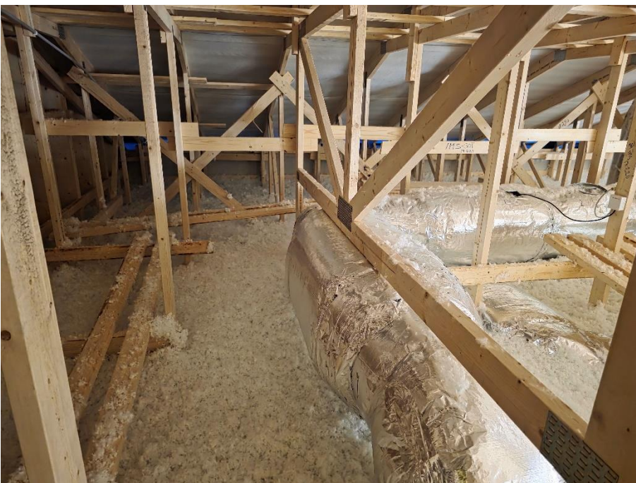
Yläpohjan puhallusvilla asennettu