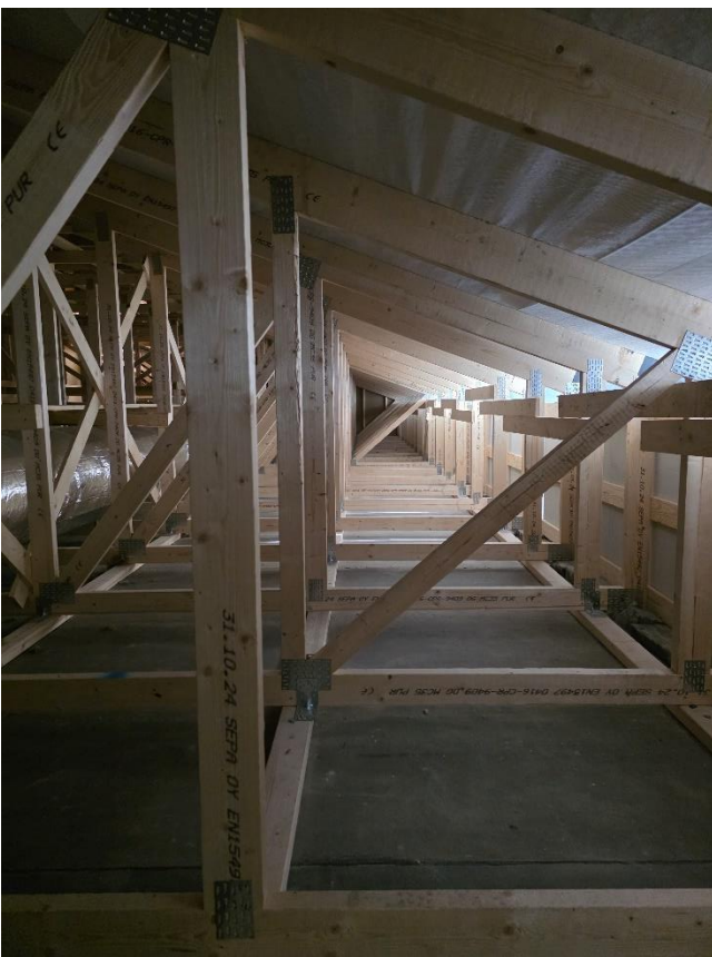
Vesikaton puutyöt valmiit ja yläpohja siivottu ennen puhallusvillan asennusta