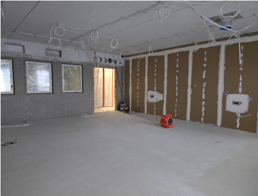
2. krs luokkahuoneiden levyväliseinät valmiit