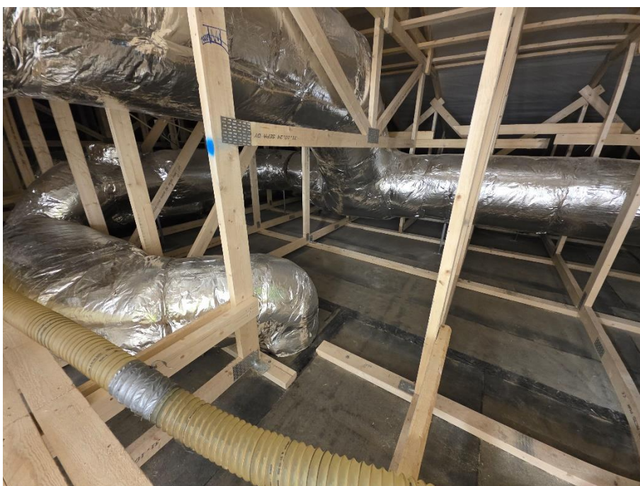
Yläpohjan IV-kanavat asennettu ja eristetty