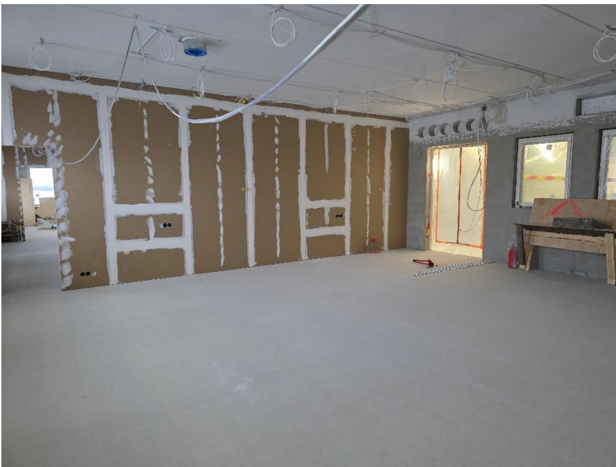
2. krs luokkahuoneiden levyväliseinät valmiit