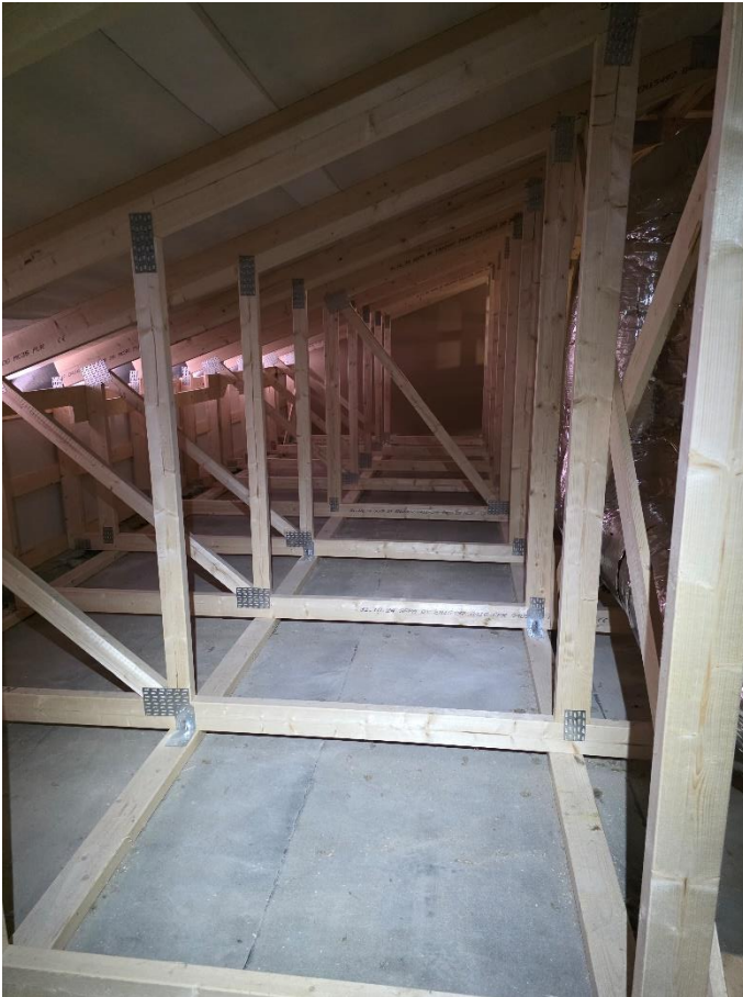
Vesikaton puutyöt valmiit ja yläpohja siivottu ennen puhallusvillan asennusta