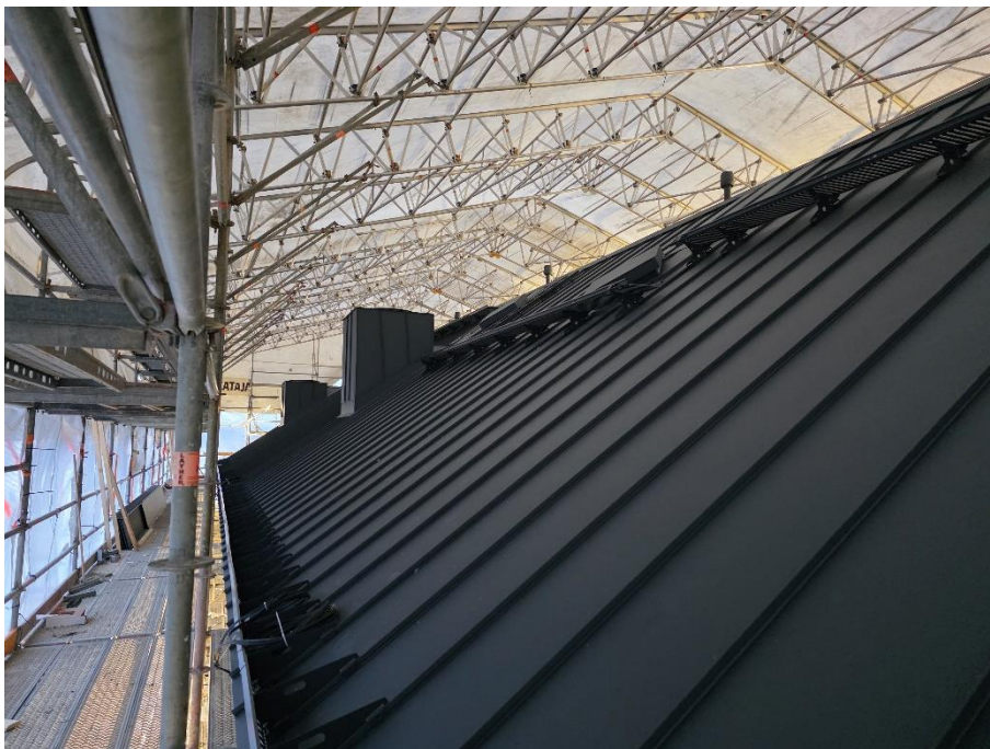
IV-piippujen pellitykset valmiit ja kattoturvatuotteet asennettu