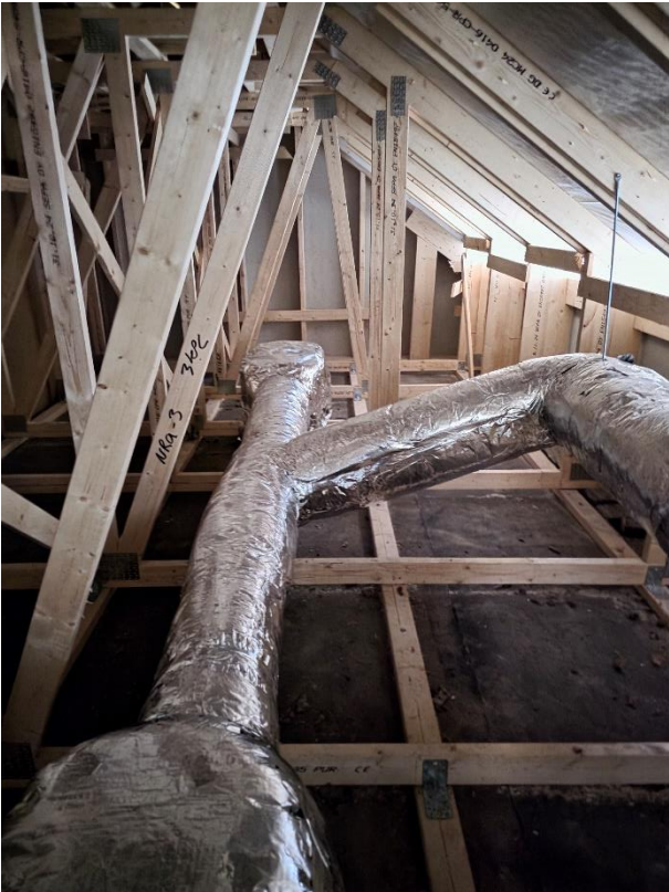
Yläpohjan IV-kanavat asennettu ja eristetty