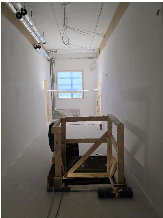
1. krs luokkahuoneiden tasoitetyöt käynnissä