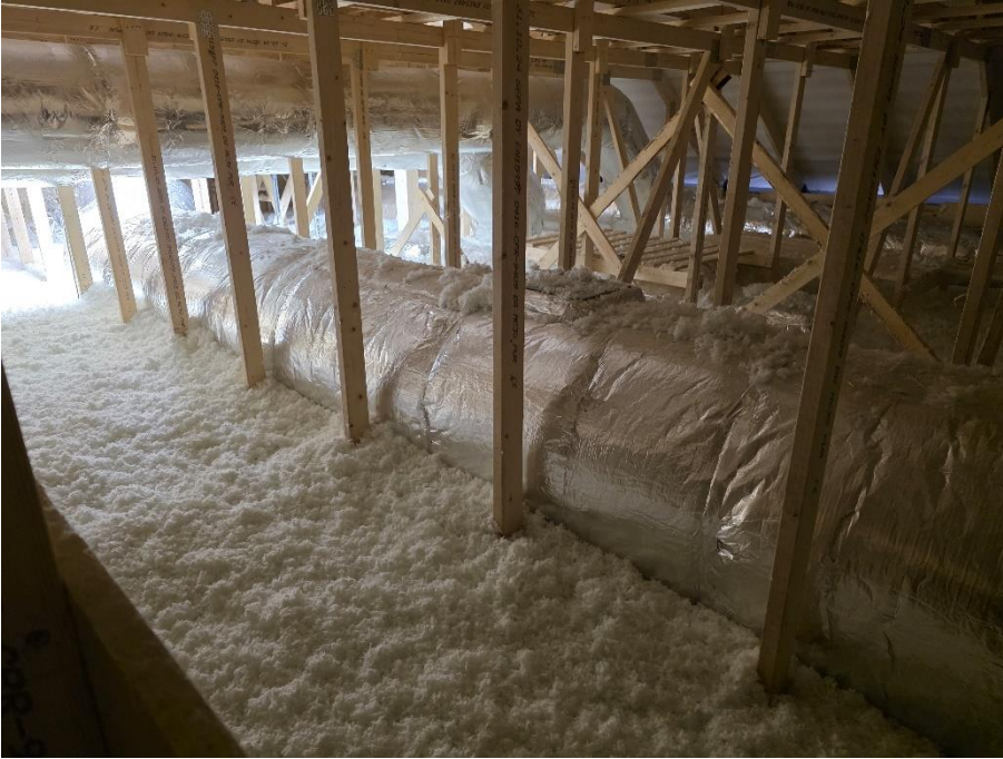
Yläpohjan puhallusvilla asennettu